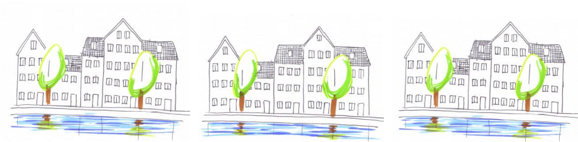
Schetsen van bebouwingvoorbeelden aan de Amstel (maximaal 4 lagen met incidentele accenten)

Het beeldkwaliteitplan beschrijft op heldere wijze de beleidsdoelstellingen van de gemeente Uithoorn met betrekking tot de ontwikkeling van de ruimtelijke ontwikkeling. De nota geeft daarnaast duidelijk aan wat met het beeldkwaliteitskader wordt beoogd en op welke wijze het is ingebed in het grotere geheel van het gemeentelijk beleid. De commissie adviseert de ruimtelijke uitgangspunten van de nota toch vooral als leidraad te blijven hanteren in het proces.