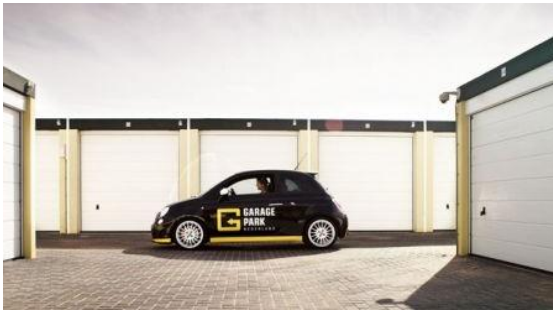
Interieur Garage Park