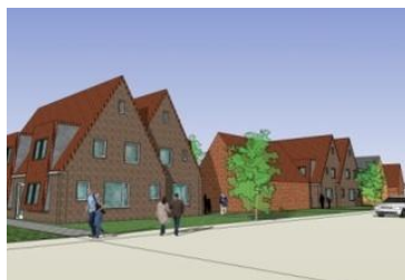
Woningen aan de Boterdijk

op diverse locaties aan de Boterdijk. De zorgvuldige inpassing van nieuwe woningen in een bestaande omgeving van kleinschalige woningbouw is een voorbeeld van een ontwikkeling die de komende jaren vaker aan de orde zal zijn. De economische stagnering zal in combinatie met een stabiel bevolkingsaantal in de nabije toekomst waarschijnlijk vaker leiden tot verbetering van de bestaande woningvoorraad dan tot uitbreiding. De adviezen van de commissie bij dit plan richten zich vooral op het ondersteunen van de in het plan aanwezige kwaliteiten voor het openbare gebied.