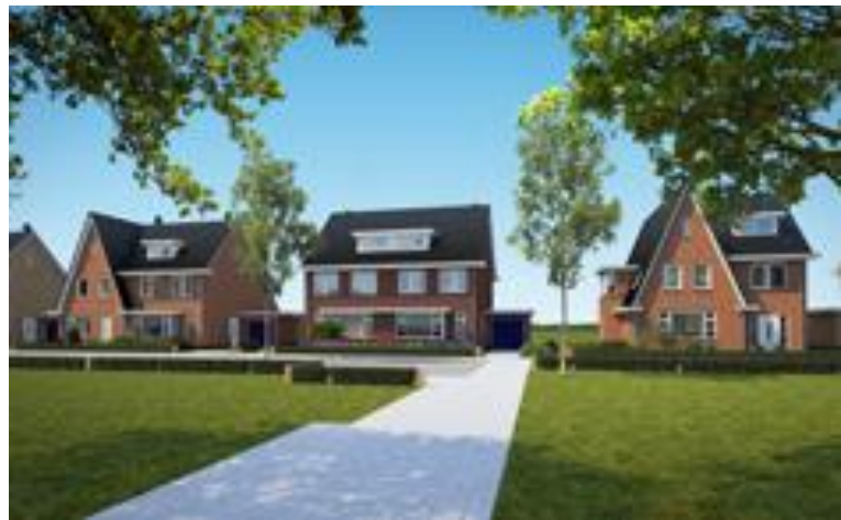
2 onder 1 kap woningen De Oker, Kwakel Zuid

Een bouwplan gelegen aan de rand van Uithoorn met direct uitzicht op het buitengebied. Na wijzigingen in het plan heeft de commissie zich vooral hard gemaakt voor het behoud van de doorzichten naar het omringende open landschap. De commissie heeft zich op het standpunt gesteld dat deze kwaliteit uit het stedenbouwkundig plan van groot belang is voor de ruimtelijke kwaliteit van de gehele wijk, maar misschien nog wel meer voor de woonkwaliteit van de toekomstige bewoners in deze omgeving.