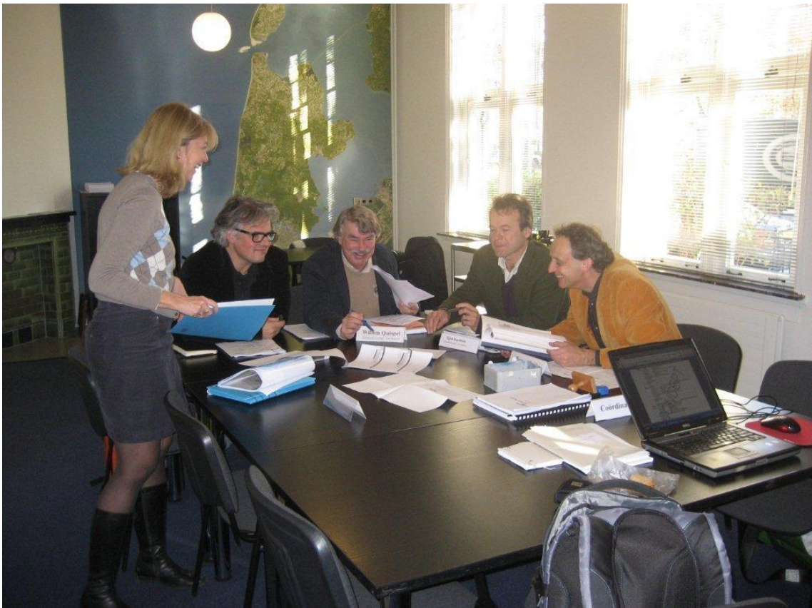
De commissie aan het werk, met de commissiecoördinator