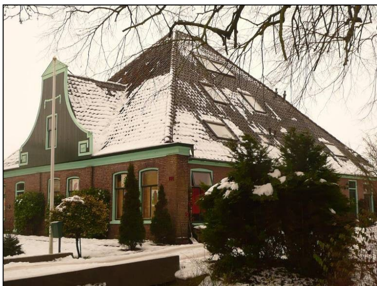
De commissie op werkbezoek in Twisk.

In 2010 zullen wij naar aanleiding van de afspraken onze werkwijze in uw gemeente als volgt inrichten: de welstandscommissie Medemblik blijft in 2010 onderdeel van de regiocommissie West-Friesland, die haar plenaire vergaderingen houdt in het gemeentehuis van Medemblik (locatie Midwoud). Aan deze regiocommissie worden ook de gemeenten Opmeer en Koggenland toegevoegd. Kleinere plannen waarbij de beoordeling conform