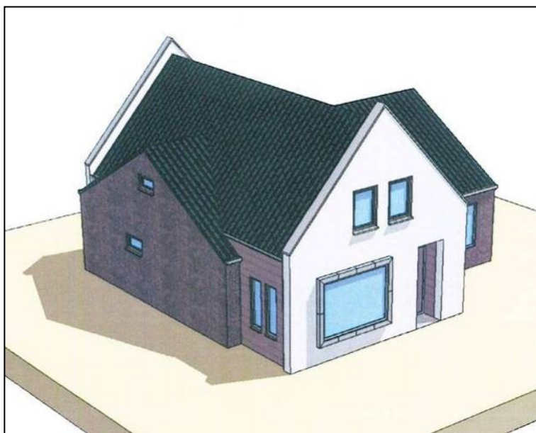
Op de vorige pagina het tweede en hierboven het derde (definitieve) plan Lindestraat 7 Wognum; het deel met donker metselwerk is het oude volume.