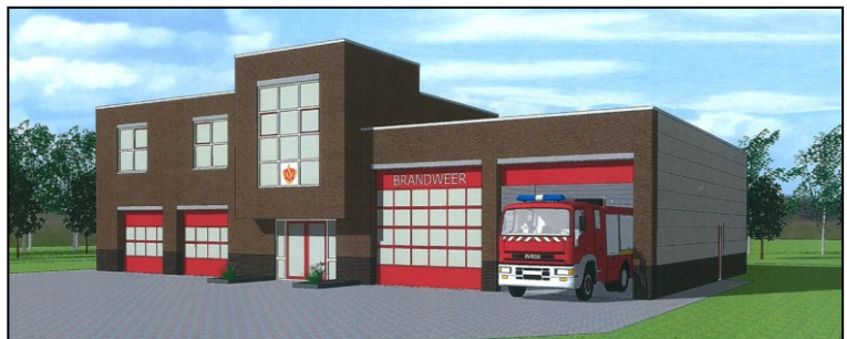
Eerste en tweede ontwerp voor de nieuwe brandweerkazerne in Nibbixwoud.