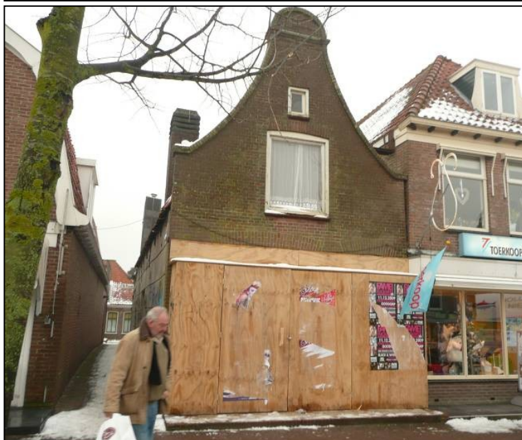
Panden aan de Nieuwstraat ; de commissie adviseerde negatief over het voornemen de klokgevel te laten stuken. Stucwerk vormt in beginsel een uitzondering in het beschermd stadsgezicht.