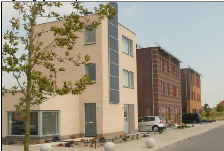
Zonnepanelen in de 'Stad van de zon' als onderdeel van de architectuur.

De commissie is zeer verheugd dat de aanbevelingen die in het jaarverslag van 2008 zijn gedaan nagenoeg allemaal zijn opgevolgd. De commissie doet naar aanleiding van 2009 de volgende aanbeveling, zoals reeds is besproken bij het jaarlijkse evaluatiegesprek met de wethouder: de commissie adviseert het gemeentebestuur om te voorkomen dat bij stedenbouwkundige en architectonische planvorming, de functies van stedenbouwkundige, stedenbouwkundige supervisor en architect in één persoon verenigd worden. Het is de commissie het afgelopen jaar gebleken dat concentratie van functies in een dubbelrol niet automatisch leidt tot de hoogst mogelijke ruimtelijke kwaliteit.