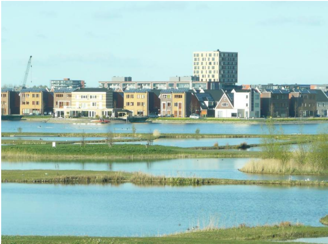
De 'Stad van de Zon' nadert zijn voltooiing.