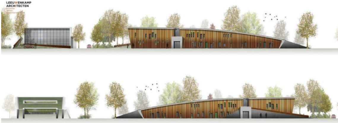
Nieuwbouw voor de gemeentewerf aan de Beukenlaan.