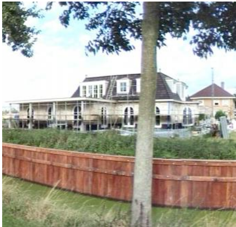
Te hoge beschoeiingen aan de Jan Glijnisweg dragen niet bij aan het landelijk karakter.