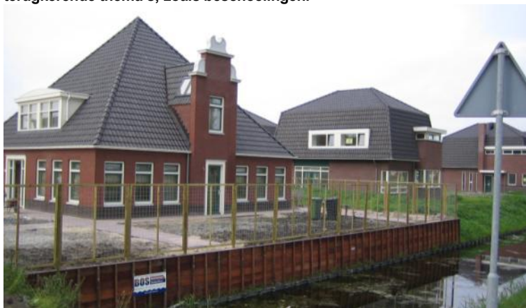
Hoge beschoeiingen vormen meestal geen positieve bijdrage aan de kwaliteit van de openbare ruimte.

Ook dit jaar werd de commissie geconfronteerd met regelmatig terugkerende thema's; zoals beschoeiingen.