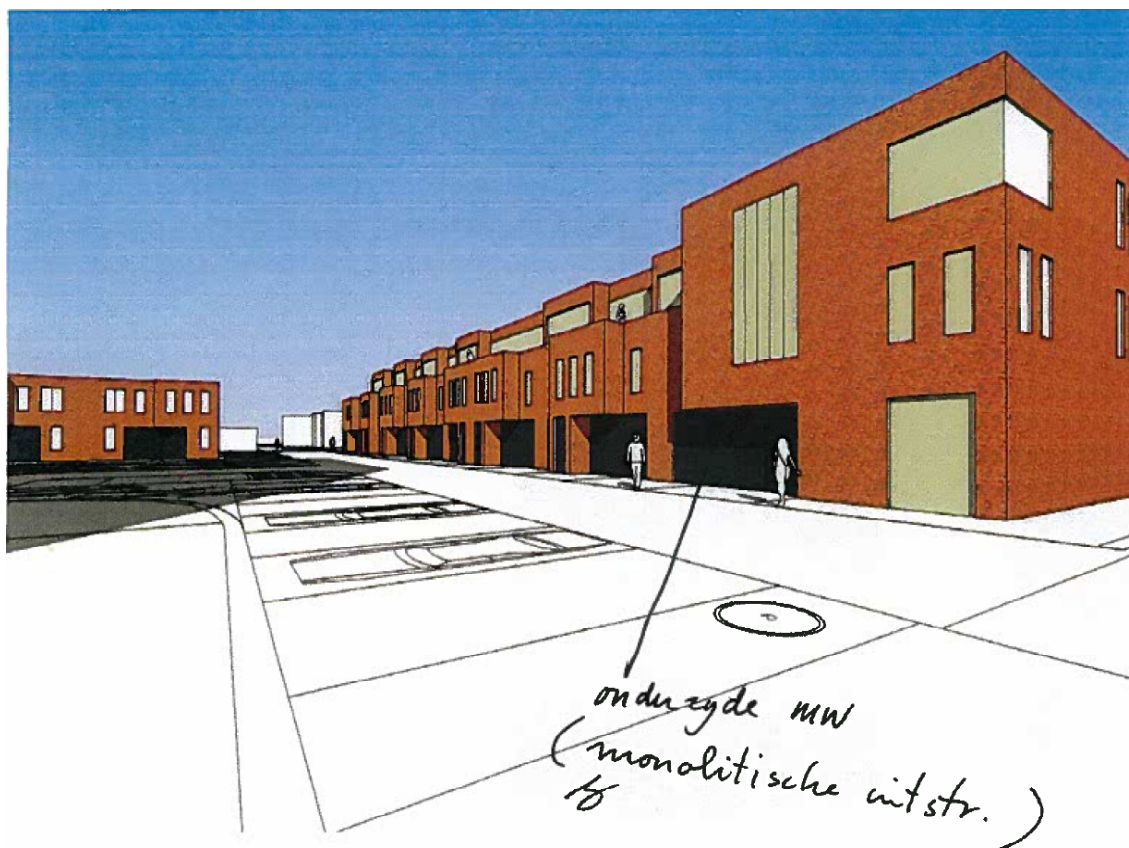
Definitief ontwerp eengezinswoningen Drechterwaard

De bijstelling van de opgave kon ook leiden tot verschraving van een ontwerp. De commissie kreeg een complex van eengezinswoningen en een appartementengebouw aan de Drechterwaard dat al in 2006 was goedgekeurd, opnieuw voorgelegd. Het ontwerp van de woningen liet een subtiele verspringing van de rooilijn zien en een geraffineerde compositie van ramen, die het verder sobere ontwerp een bijzondere kwaliteit verleenden. In het nieuwe, door de opdrachtgever voorgelegde plan werd uit economische overwegingen van de woningen een verdieping afgehaald en waren de verbijzonderingen wegbezuinigd. Op aandringen van de commissie betrok de opdrachtgever de architect alsnog bij het ontwerp. Hierdoor kwam toch nog een weliswaar sterk versoerd, maar interessant complex tot stand dat beantwoordde aan de uitgangspunten van het beeldkwaliteitsplan.