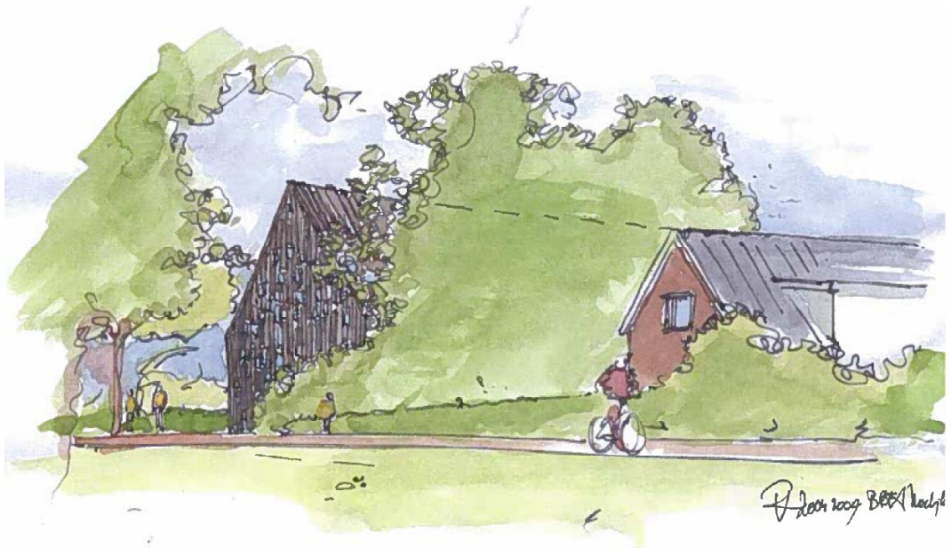
Kanaaldijk 264, definitief ontwerp zorgboerderij