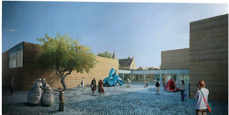
artist impression van cultureel centrum YXIE, Doelenveld

Voor grote projecten als de ontwikkeling van het culturele centrum YXIE op het Doelenveld, kan een beeldkwaliteitsplan behulpzaam zijn. In het ideale geval gaat de opstelling hiervan aan de uitwerking van het ontwerp vooraf, omdat commissie en gemeente zo gemeenschappelijke uitgangspunten voor de beoordeling kunnen formuleren. Om verschillende redenen was dat nu niet mogelijk en ging de totstandkoming van ontwerp en beeldkwaliteitsplan gelijk op. De informerende en consulterende rondes tijdens het vooroverleg werkten naar tevredenheid van ontwerper en commissie goed uit voor de kwaliteit van het uiteindelijk plan.