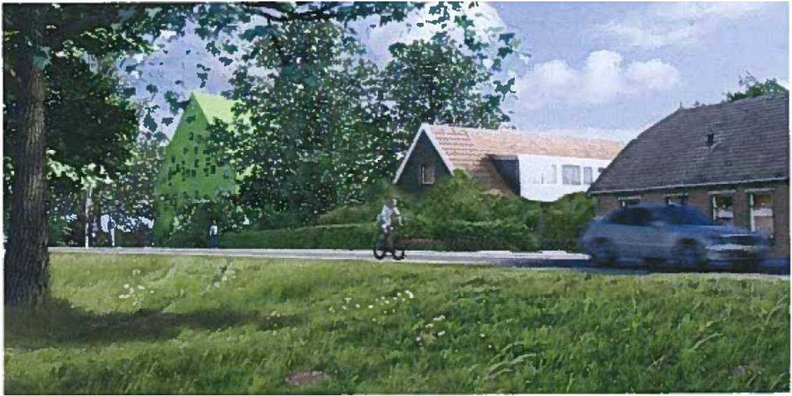
Kanaaldijk 264, eerste ontwerp zorgboerderij.