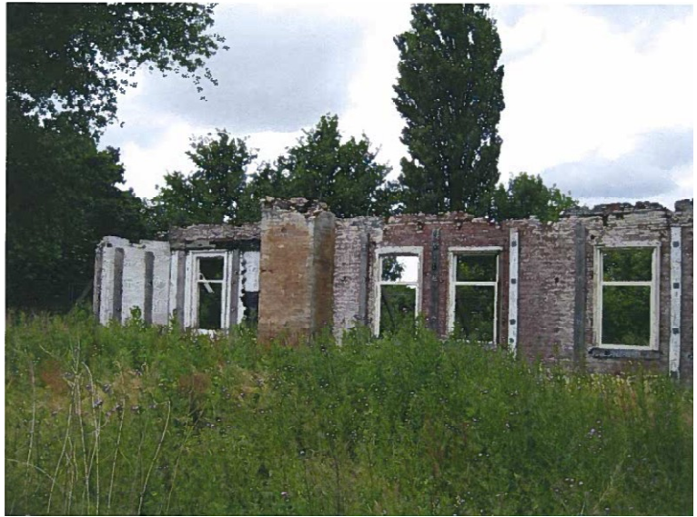
Kanaaldijk 264, restant van de stolpboerderij