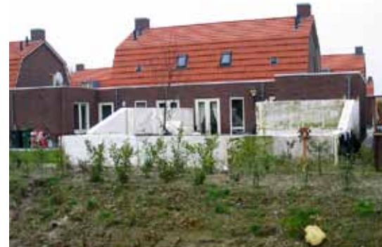
Vergunningvrije piepschuimen schutting