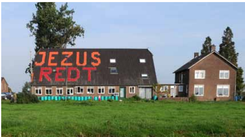
Voor en na succesvolle handhavingsactie op grond van excessencriterium, Giessenlanden (ZH)

duidelijk kenbare buitensporigheid van het uiterlijk van een bouwwerk’.