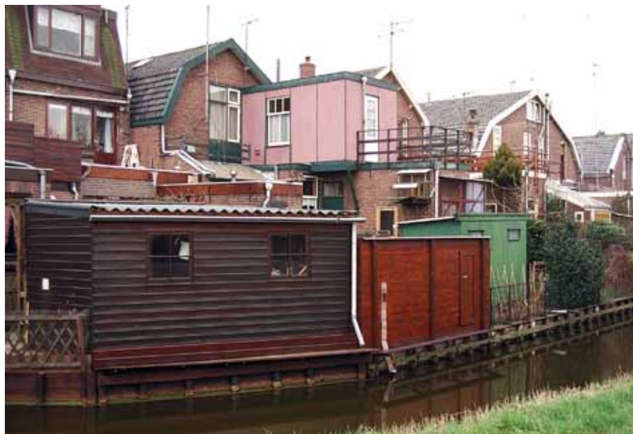
Verrommeling door vergunningvrije en illegale bouwsels op het achtererf

moet voldoen aan het Bouwbesluit en het Gebruiksbesluit, kan niet ieder gebouw dat voor de activiteit bouwen vergunningvrij is, ook daadwerkelijk worden gerealiseerd. Mogelijk is er wel een omgevingsvergunning nodig voor het gebruik . Indien bijvoorbeeld een horecaondernemer zijn pand aan drie zijden uitbreidt met een aanbouw van 2,5 meter diep, dan is de kans groot dat de dan gerealiseerde oppervlakte zoveel bezoekers kan herbergen dat er spanning ontstaat met de brandveiligheidseisen uit het Gebruiksbesluit. Hetzelfde geldt overigens voor een milieuvergunningplichtige inrichting: indien het oppervlak door vergunningvrije aanbouwen of bijgebouwen toeneemt, zal in de meeste gevallen tóch een omgevingsvergunning noodzakelijk zijn: niet voor het bouwen, maar voor wijziging van de inrichting.