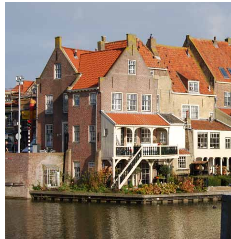
Beschermde stadsgezicht Enkhuizen

Gemeenten hebben tegenwoordig nauwelijks invloed op de aanwijzing van nieuwe rijksmonumenten. In de beleidsbrief Modernisering Monumentenzorg is aangegeven dat het Rijk zeer terughoudend zal zijn met het aanwijzen van nieuwe monumenten, en de aanwijzing van nieuwe beschermde stads- en dorpsgezichten zelfs geheel zal beëindigen. Aan de oude situatie, waarin een simpele voordracht voor plaatsing op de monumentenlijst al voldoende was om ‘voorbescherming’ tot stand te brengen, is met een recente wetswijziging een einde gekomen. Het initiatief om tot aanwijzing van