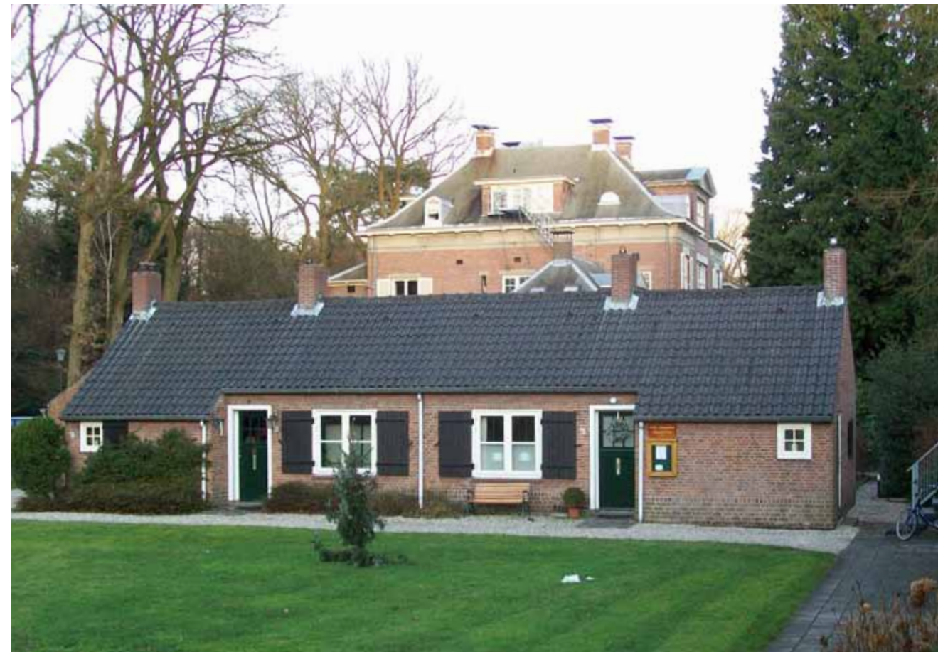
De cultuurhistorische waarde van Park Rodichem in Huis ter Heide (gem. Zeist) is met een dubbelbestemming in het bestemmingsplan beschermd

Een gemeente die in een bepaald gebied het vergunningvrije bouwen wil weren heeft het