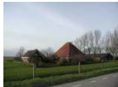
Bijgebouwen achter de voorgevelrooilijn en zo compact mogelijk