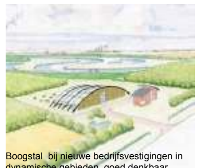
Boogstal bij nieuwe bedrijfsvestigingen in dynamische gebieden goed denkbaar