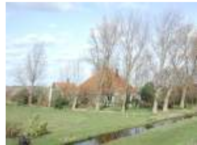
Stolp omgeven door erfplanting